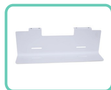
RIPIANO ANTERIORE, SLIM 2.0 ACS-202