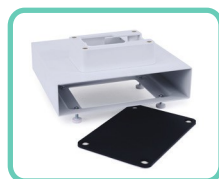
SUPPORTO MINI CPU, SLIM 2.0 ACS-200