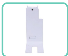
SUPPORTO LATERALE PER SCANNER, SLIM 2.0 ACS-198