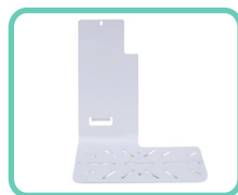
SUPPORTO LATERALE PER SCANNER WIRELESS, SLIM 2.0 ACS-197