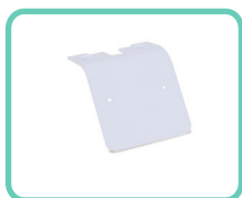
SUPPORTO LATERALE PER STAMPANTE, SLIM 2.0 ACS-199